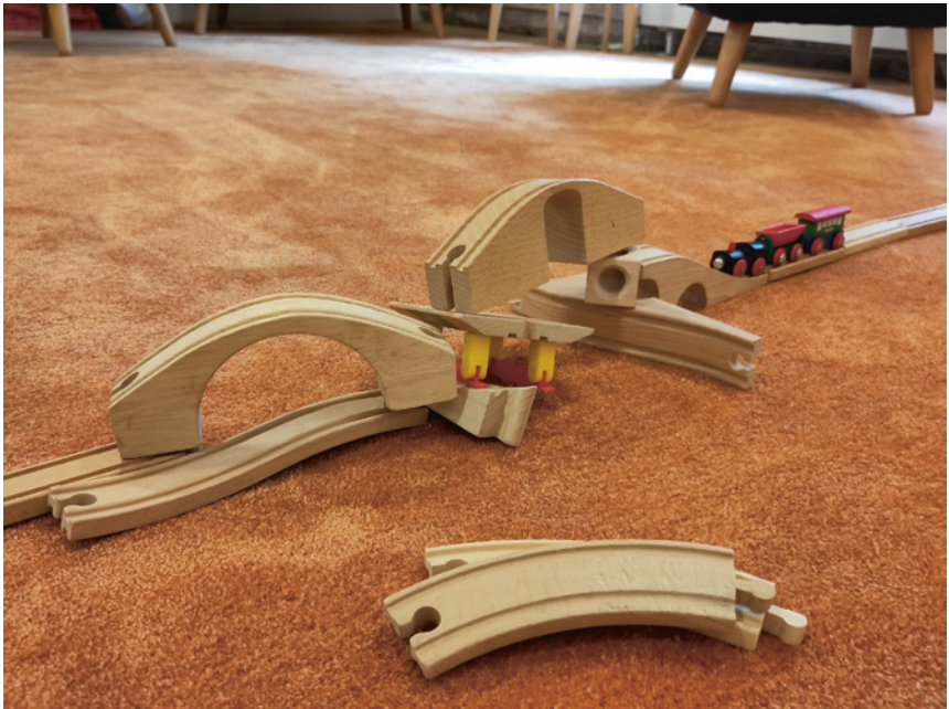
Abb. 1: Labile Brücke.

In der folgenden Sitzung entsteht eine stabilere Brücke.