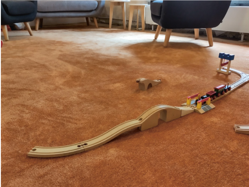
Abb. 2: Stabilere Brücke.

Es geht auf Weihnachten zu und ich frage Frau J., wie sie Weihnachten feiern würden. Sie antwortet mir, nein, sie feiern nicht Weihnachten, sondern Chanukka. Ich sage, ah, Sie sind jüdisch. Darauf erwähnt sie wie nebenbei, ja, sie komme aus Ex-Jugoslawien, ihr Großvater sei im Ghetto gewesen und schließlich in Auschwitz, wo er als Einziger aus der Familie den Holocaust überlebt habe. Begeistert erzählt sie, dass sie Klezmer-Musik gemacht, liebend gern gesungen habe, und wie sie sich der jüdischen Kultur verbunden fühle.